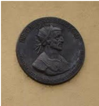
Slika 5: relief cesarja Probusa