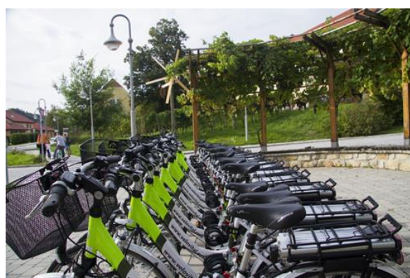
Slika 12: kulEbjki