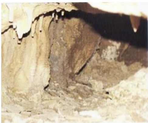
Slika 8: lovska jama