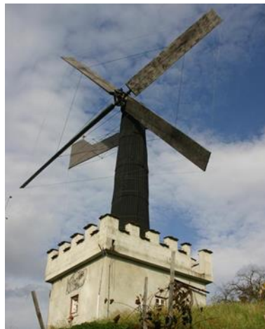
Slika 9: Vogrinov mlin