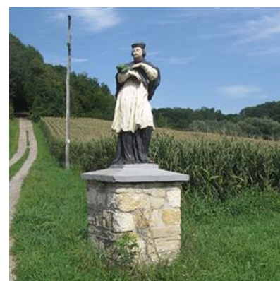
Slika 7: kip Johanesa