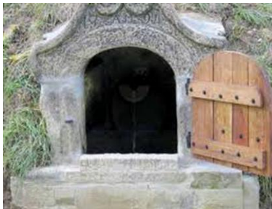
Slika 10: Bolnarjev studenec