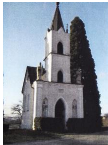
Slika 11: Mulečeva kapela