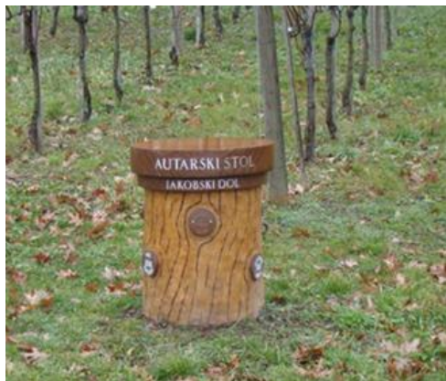
Slika 2: autarski stol Vir slike: Mojca Križanec osebno