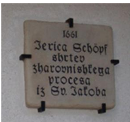
Slika 6: spominska plošča Jerici Schopf

https://dekanijajarenina.wordpress.com/sv-jakob-v-slovenskih-goricah