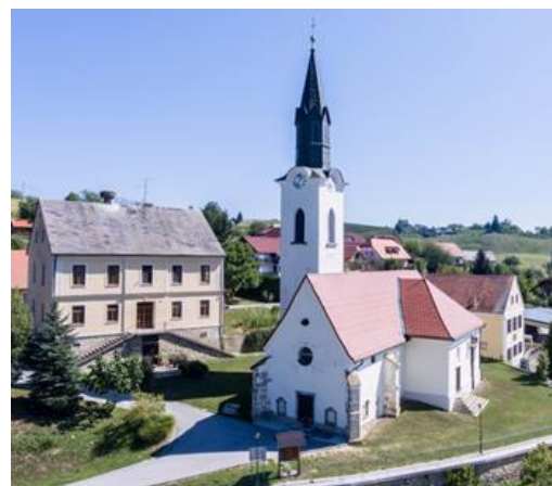
Slika 4: cerkev sv. Jakoba