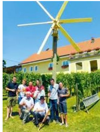
Slika 3: ampelografski vrt in klopotec