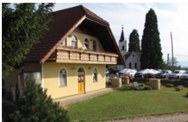
Slika 13: vinogradniška kmetija Mulec